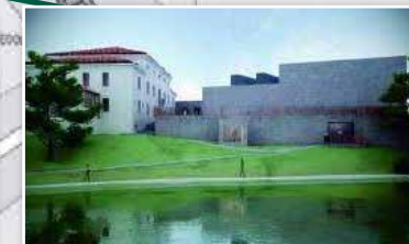
GALLERIA D'ARTE MODERNA E CONTEMPORANEA "A. PIZZINATO"