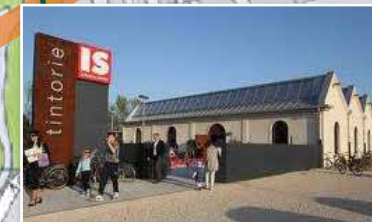
SCIENCE CENTER IMMAGINARIO SCIENTIFICO