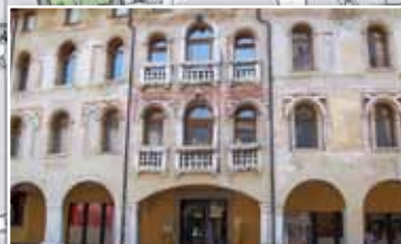
MUSEO CIVICO D'ARTE RICCHIERI