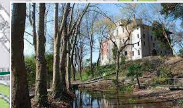
MUSEO ARCHEOLOGICO DEL FRIULI OCCIDENTALE