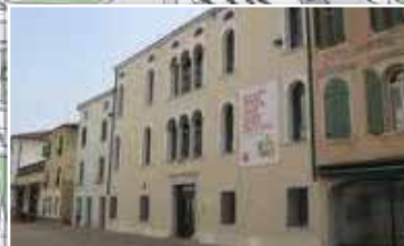
MUSEO CIVICO DI STORIA NATURALE