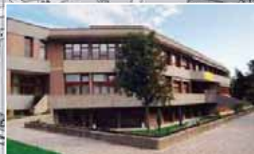
CENTRO CULTURALE CASA A. ZANUSSI Pressé Photo Lancia