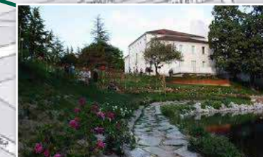
MUSEO ITINERARIO DELLA ROSA ANTICA-MIRA