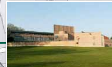
MUSEO DIOCESANO DI ARTE SACRA