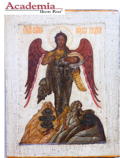
SAN GIOVANNI ANGELO DEL DESERTO" Russia: Scuola di Mosca metà del secolo 1600 Tempera all'uovo su tavola - cm 24,5 X 31

Gli Amici dell' Astoria ASTORIA HOTEL ITALIA