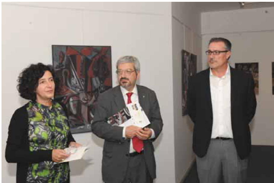
Inaugurazione della mostra di Nata Relicta 85-86, 1 ottobre 2010, alla presenza del Sindaco