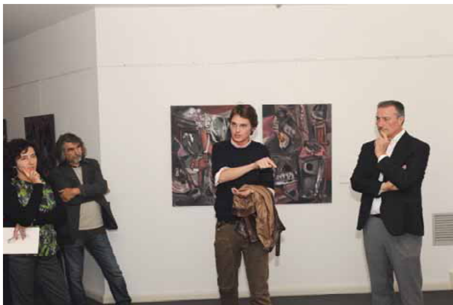
Inaugurazione della mostra di Nata Relicta 85-86, 1 ottobre 2010