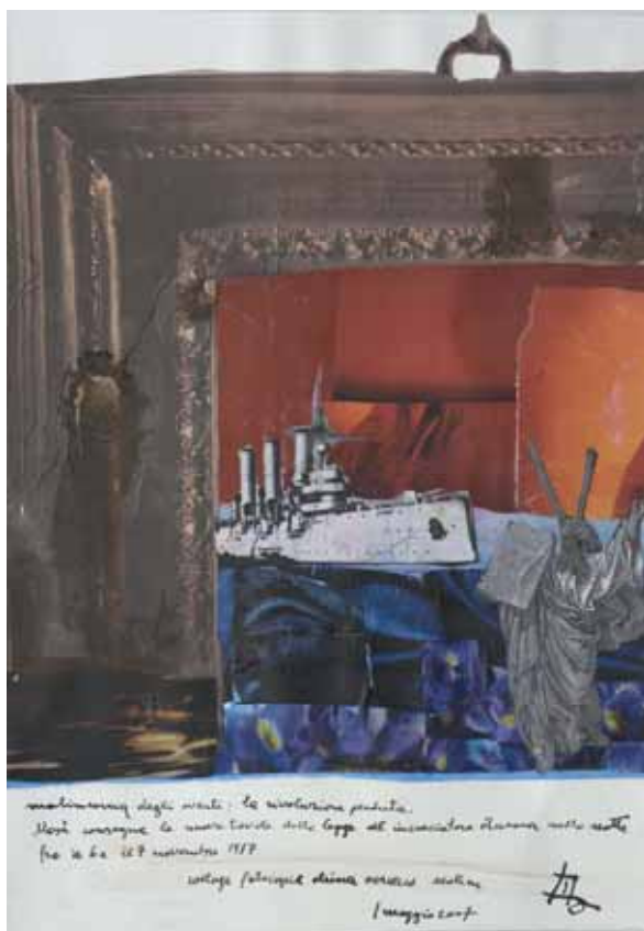
Tito Maniacco, Malinconia degli eventi: la rivoluzione perduta , 2007

Nella primavera 2010, secondo le disposizioni testamentarie dello scrittore e artista friulano Tito Maniacco (Udine, 1932-2010) un nucleo di undici suoi lavori è entrato a far parte delle collezioni della Galleria d'Arte Moderna di Udine. Insegnante, scrittore, poeta, storico e critico, esordisce come poeta e pittore negli anni Cinquanta con componimenti di matrice neorealista che da subito dichiarano l'impegno sociale e politico sul quale avrebbe trovato fondamento un'intera ricerca. La bibliografia di Maniacco è scandita da opere che spaziano dalla poesia alla saggistica, dalla ricerca storica al racconto autobiografico. Figurano, tra i suoi titoli, I senza storia. Storia del Friuli. L'ideologia friulana. Critica dell'immaginario collettivo o Mestri di mont . Nel 2002 ha ricevuto il Premio Epifania e sei anni dopo il Comune di Udine gli ha conferito il sigillo della città. Le opere donate al Museo udinese, comprese tra il 1965 e il 2007, comprendono tecniche miste su carta nelle quali sono sperimentate le soluzioni espressive più varie: inchiostri, aniline, collage di ritagli da rotocalchi e fotocopie, trasferimento con la trielina e mordente per legno. Il collettivismo essenza della rivoluzione, L'isola dei morti Böcklin, En attendant Godot sono alcune delle opere donate, nelle quali è un atteggiamento mentale a prevalere, anche se non manca un divertimento ludico nel manipolare i materiali e nell'accostare immagini in modo solo apparentemente casuale.