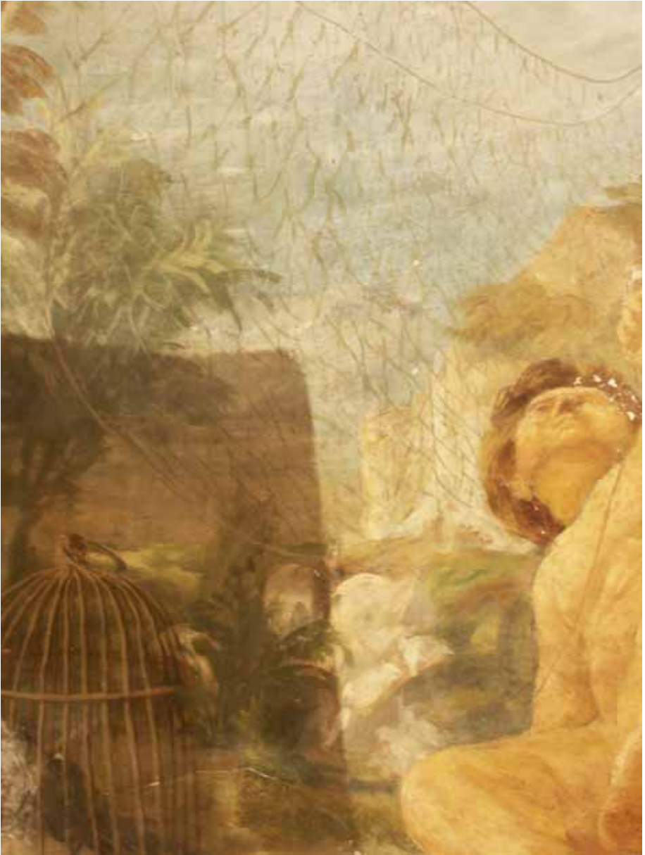
Afro, particolare di una vela dell'appartamento di Dante Cavazzini durante il restauro