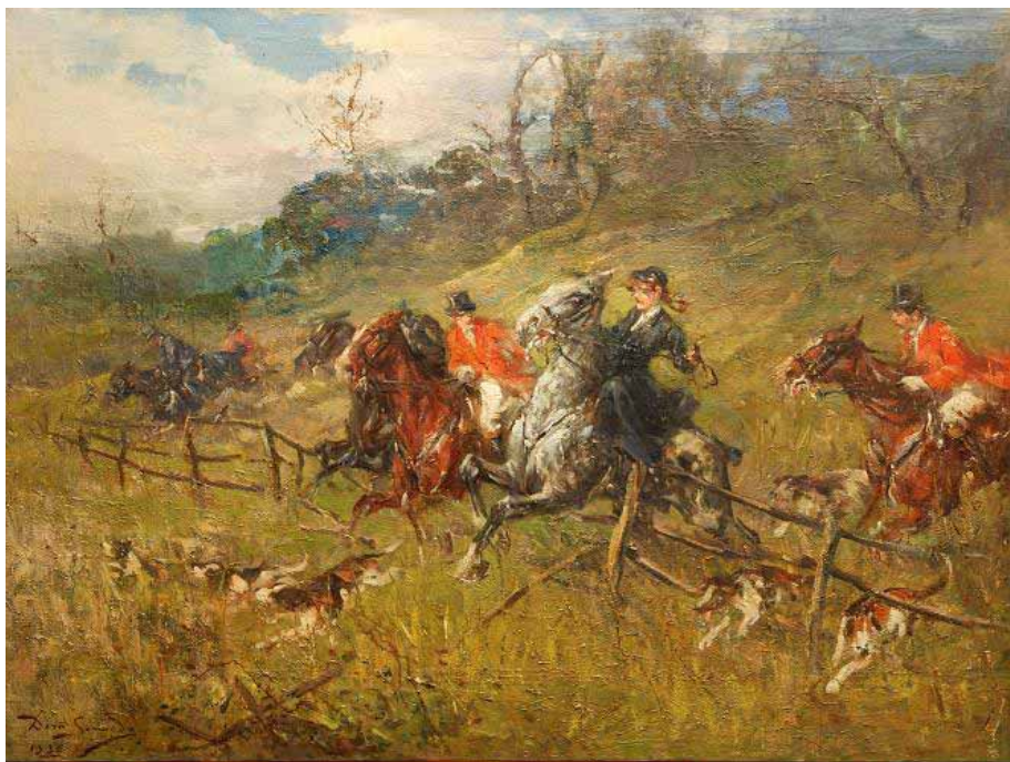
Domenico Someda, Scena di caccia alla volpe nella campagna romana , 1936, olio su tela

La Galleria d'Arte Moderna di Udine ha avviato quest'anno una serie di iniziative denominata "Cantiere Cavazzini" con l'intento di far conoscere al pubblico le opere conservate nei suoi depositi e solitamente non esposte, ora oggetto di studio e catalogazione. In questo contesto si inserisce la mostra dedicata al pittore Domenico Someda (Rivolto, UD, 1859 – Udine, 1944) del quale si espongono per la prima volta i dipinti pervenuti nel 2007 grazie al lascito testamentario del prof. Valentino Vidoni, docente di Medicina Legale presso le Università di Udine e Parma. Si tratta di una ventina di dipinti – ritratti, paesaggi, vedute romane, scene di caccia e interni, tra cui anche i bozzetti per i capolavori Amore e Patria (1897) e La morte di Ermengarda . Sono opere dal gusto estetizzante, caratterizzate da una stesura pittorica veloce e bozzettistica che riscopre la lezione settecentesca rivelando la sua modernità nel dialogo con la maniera veloce e brillante di Giovanni Boldini in voga durante la Belle Époque .