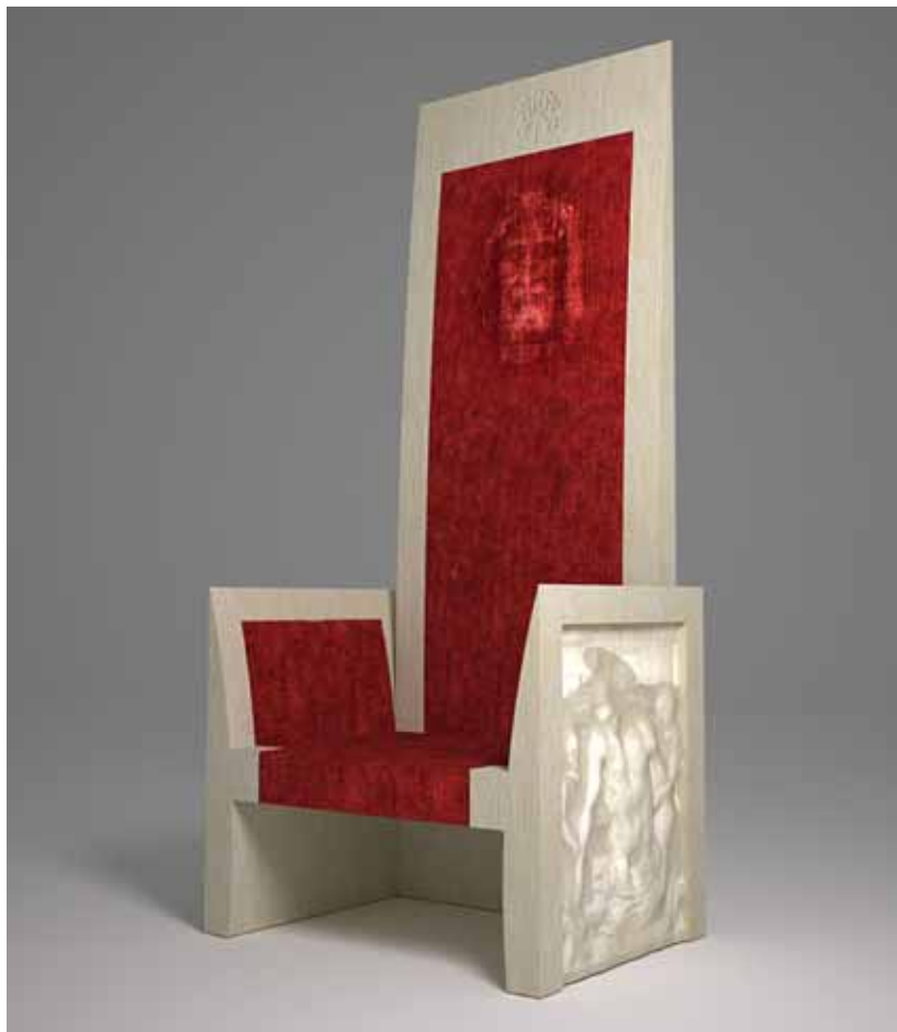
Il trono papale, progetto dell'architetto Ivan Vergendo

Alle Gallerie del Progetto di Udine arriva il nuovo Trono papale: l'opera, presentata ufficialmente alla stampa lo scorso 13 aprile, e utilizzata da papa Benedetto XVI durante la messa del 2 maggio 2010 a Torino, verrà esposta nella terra dove è stata progettata e costruita.