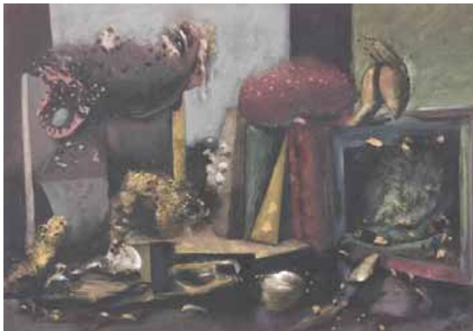
Nata, Relicta n. 17 , 1986, acrilico su tela

Continua, dopo le personali dedicate a Giancarlo Venuto, Walter Bortolossi e Massimo Poldemengo, allestite tra aprile e agosto, la serie programmata sotto il titolo Questo l'ho fatto io!, dedicata agli artisti del Museo dentro il Museo.