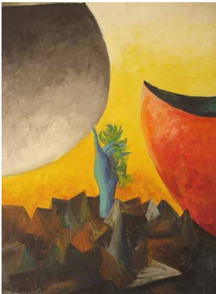
Marcello D'Olivo, Albero nello spazio , olio su tela (coll. priv.)

MARCELLO D'OLIVO: UNA MOSTRA TRA ARTE E ARCHITETTURA